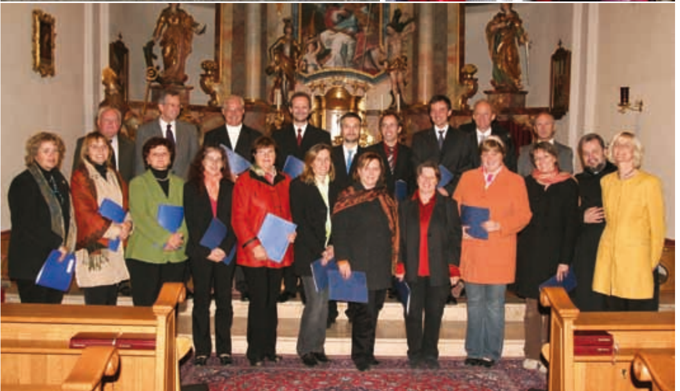
Geistliche Abendmusik in Pöttsching, Oktober 2008